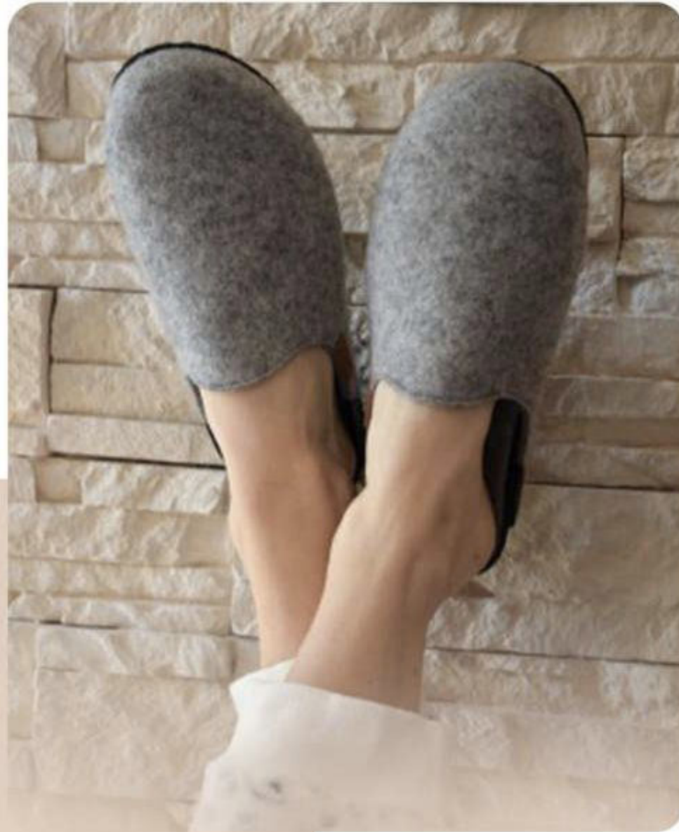
LILIANE LAINE GRIS