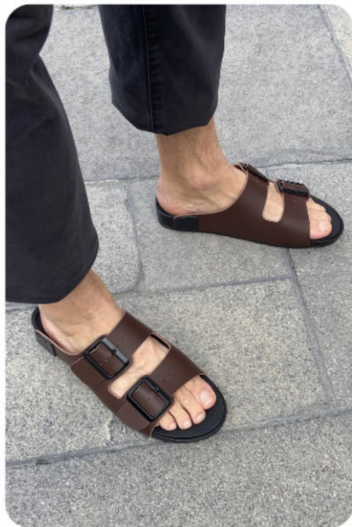
MALO - MARRON