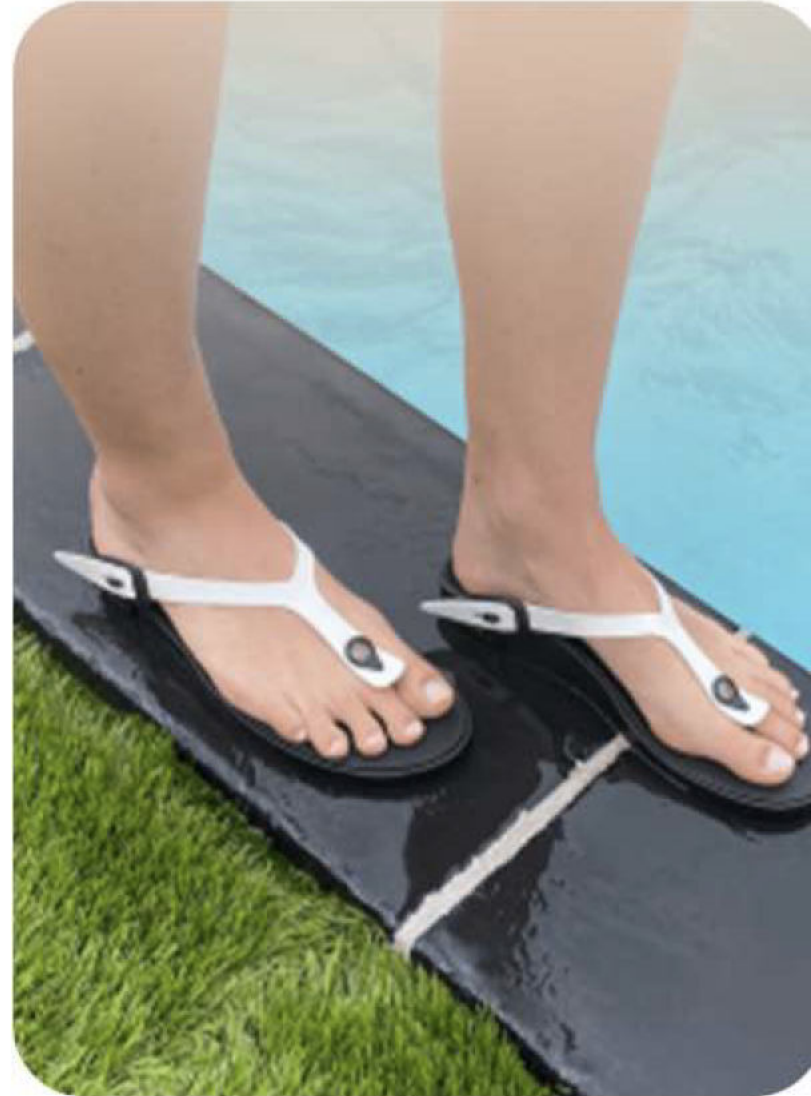
LINA - BLANC