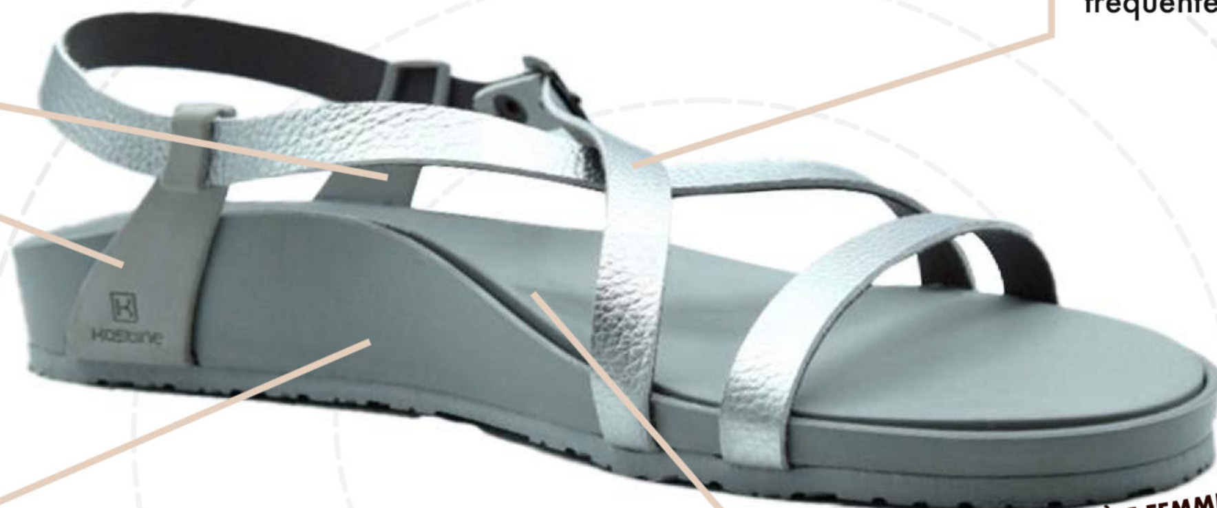
SCHÉMA AVEC LE MODÈLE FEMME

Ses brides sobres et efficaces sont ajustables pour s'adapter à tous types de pieds. Elles sont prévues pour ne pas frotter au niveau des déformations des orteils fréquentes chez la femme (du type Hallux Valgus...)