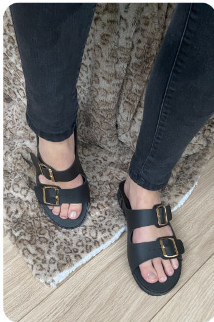
ROMANE - NOIR