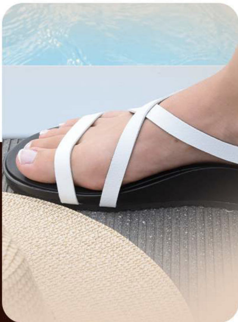
ANAÏS - BLANC