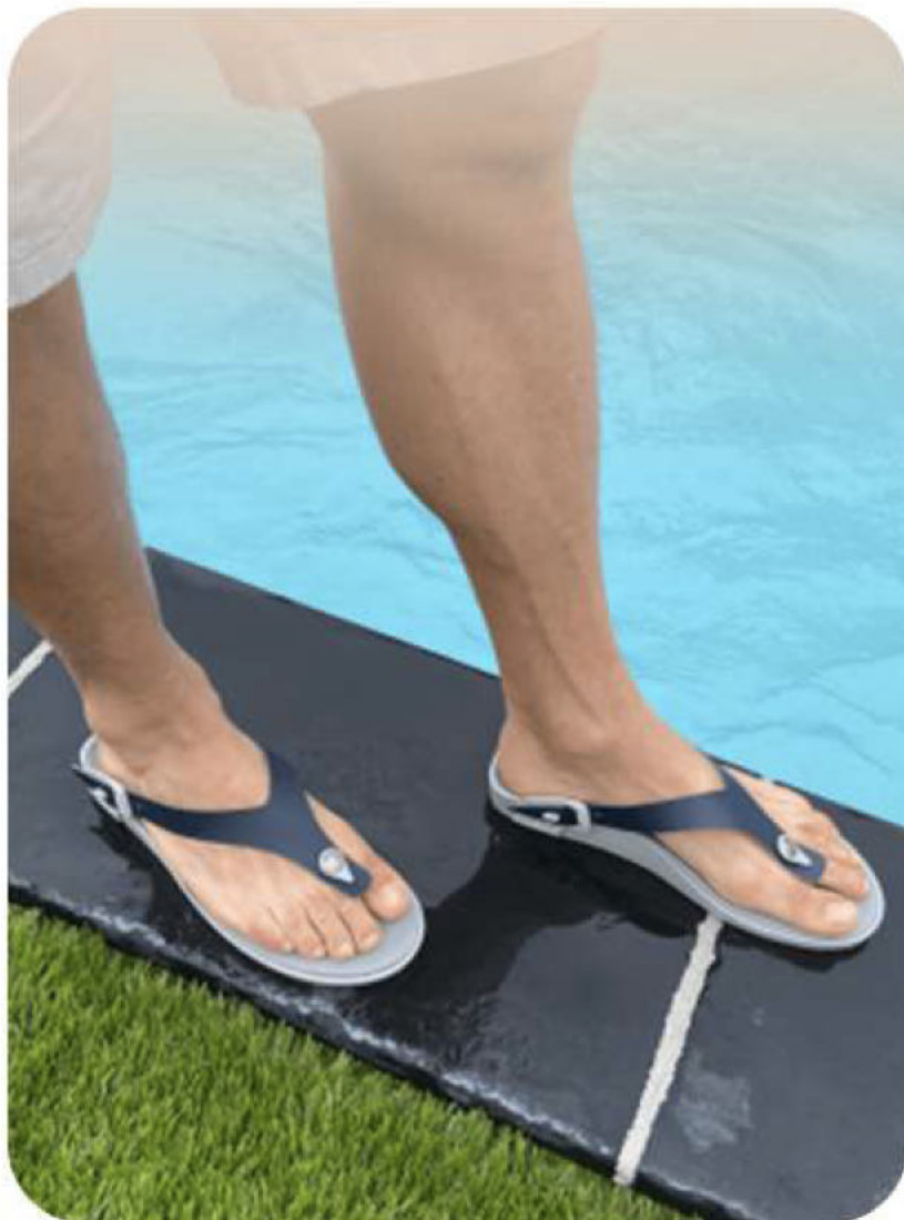
TITOUAN - MARINE