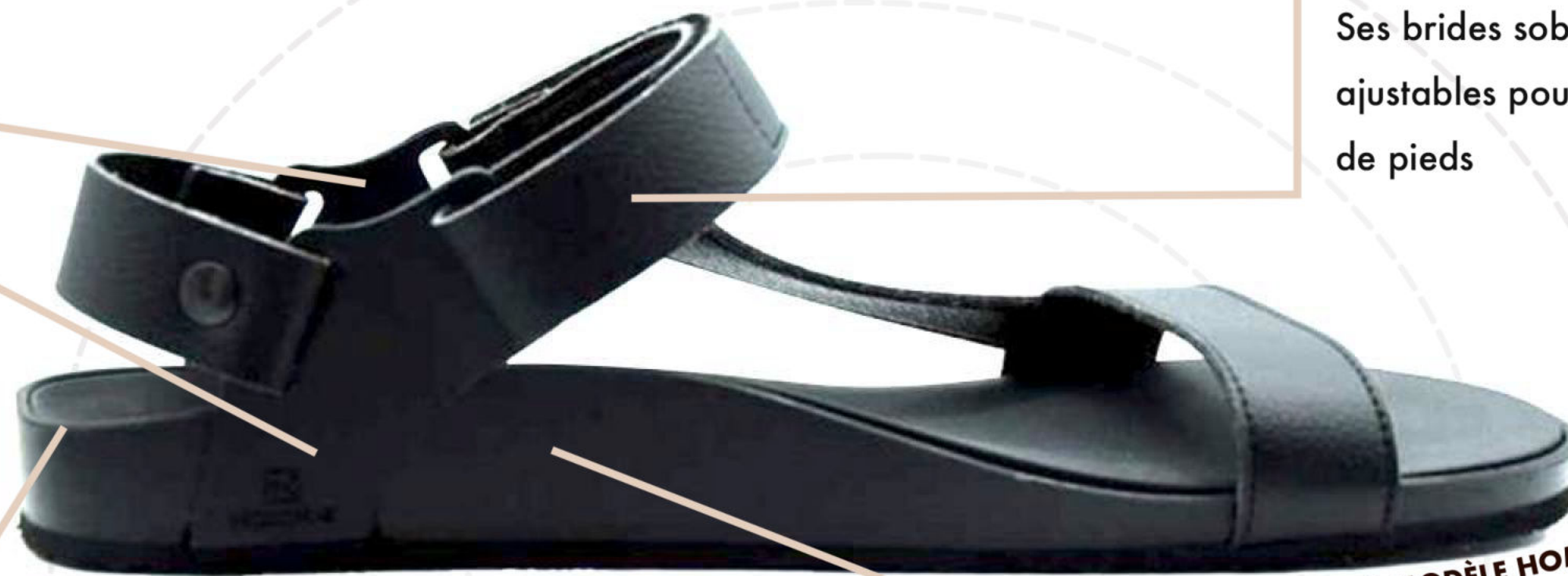
SCHÉMA AVEC LE MODÈLE HOMME

Ses brides sobres et efficaces sont ajustables pour s'adapter à tous types de pieds