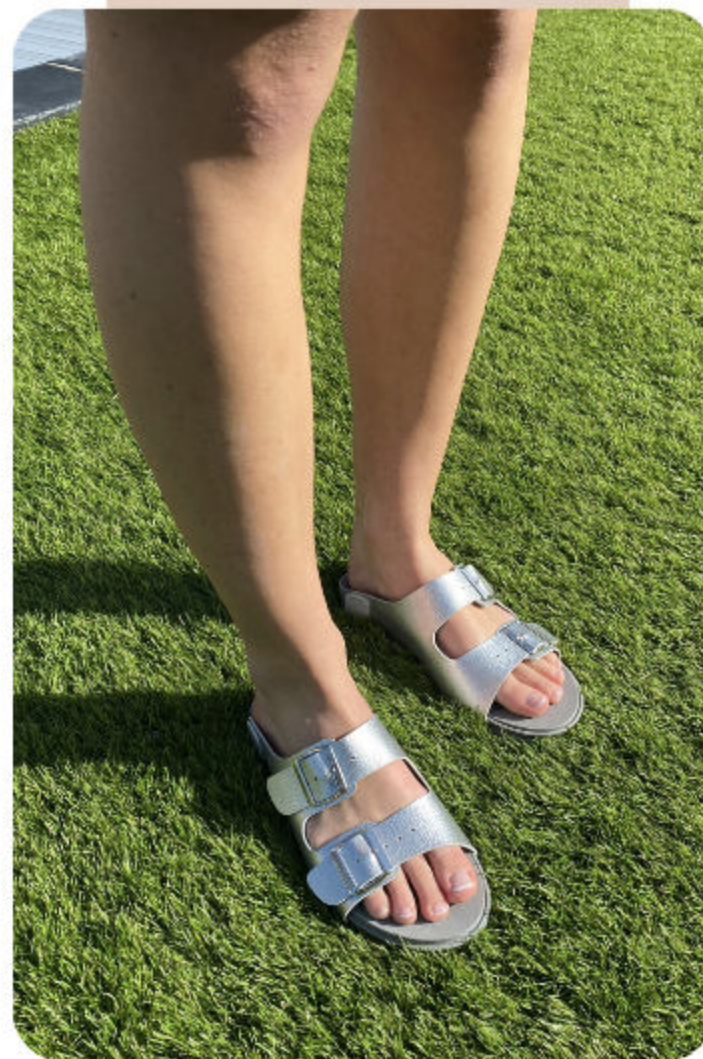
ROMANE - ARGENT